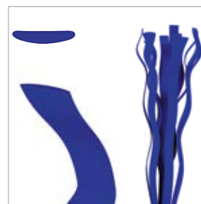
Fibertjocklek: cirka 110 µm