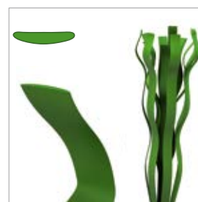
Faserdicke: ca. 100 µm