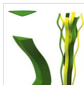
Faserdicke: ca. 250 µm