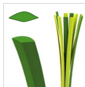
Faserdicke: ca. 400 µm