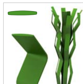
Épaisseur de fibre : env. 160 µm