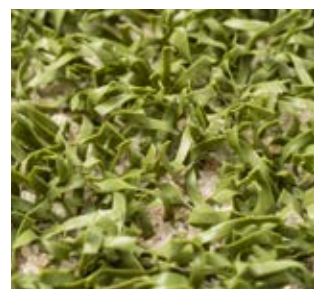
Granulats de remplissage