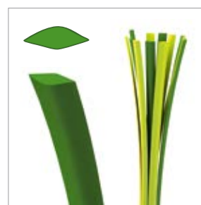
Faserdicke: ca. 360 µm