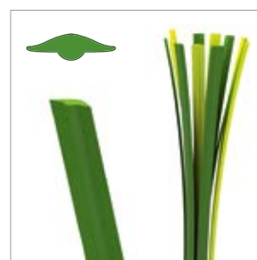
Faserdicke: ca. 360 µm