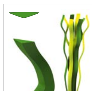
Épaisseur de fibre : env. 250 µm