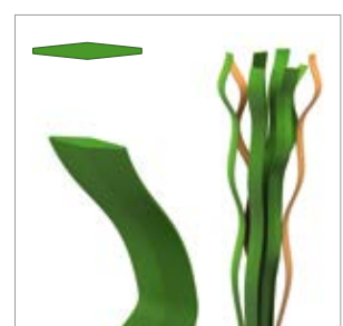
Épaisseur de fibre : env. 120 µm