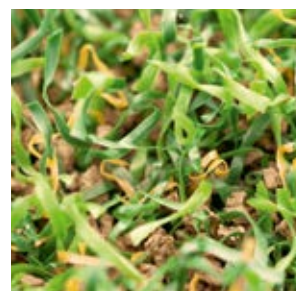
Granulats de remplissage